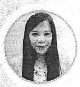
พว.ปิยะนันท์ ทิวโสตก อ.พกามาศ พิมพ์ธรา sw. พระปกเกล้า วพ.พระปกเกล้า จันทบุรี