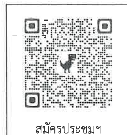
สมัครประชุมฯ