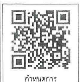
กำหนดการ