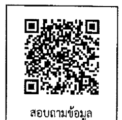
การสมัคร