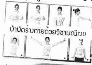
บำบัดร่างกายด้วยวิชามันวิเศษ