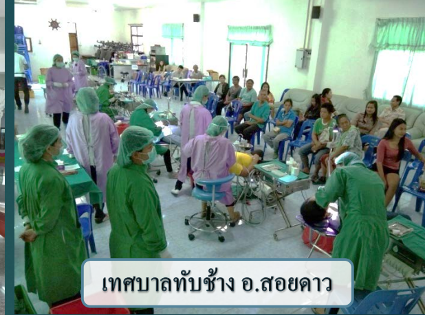
เทศบาลทับช้าง อ.สอยดาว