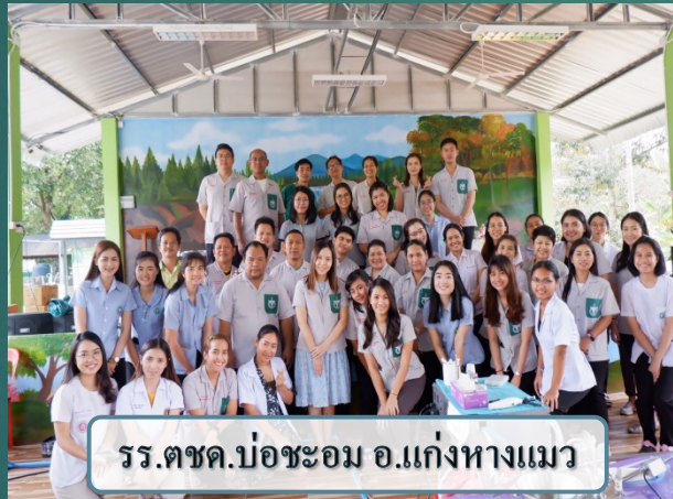
ร.ร.ตชด.บ่อชะอม อ.แก่งหางแมว