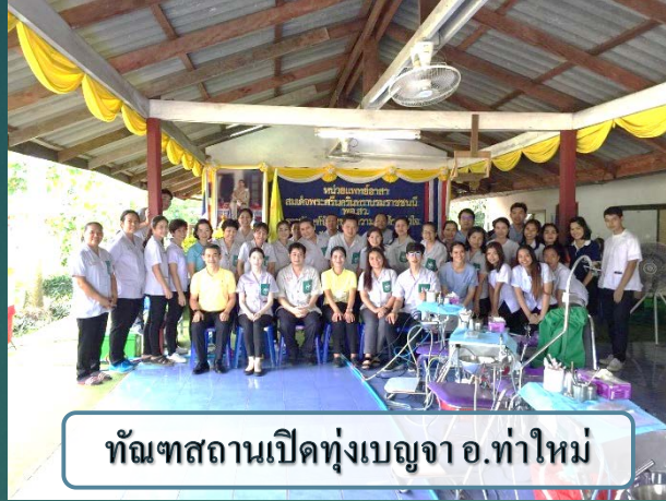
ทัตถสถานเปิดทุ่งเบญจา อ.ท่าใหม่