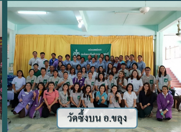
วัดชิงบน อ.ขลุง