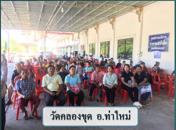
วัดคลองชูด อ.ท่าใหม่