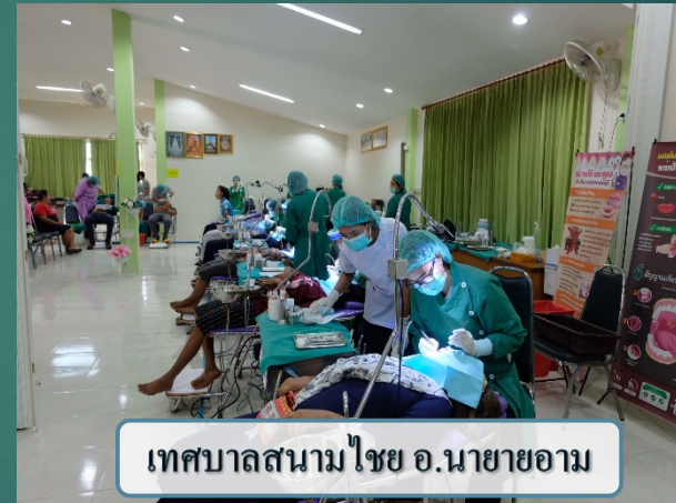
เทศบาลสนามไชย อ.นายายอาม