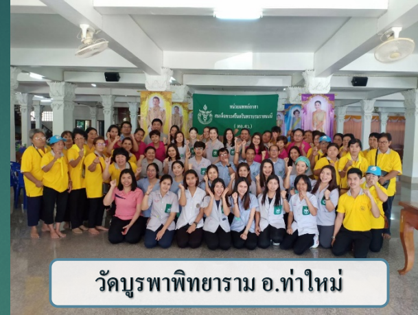
วัดบูรพาพิทยาราม อ.ท่าใหม่