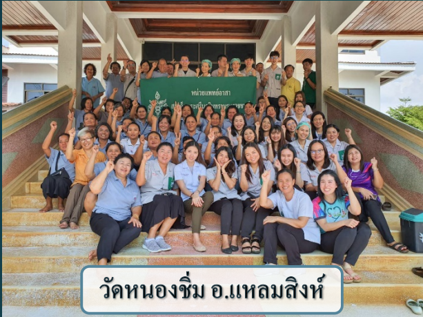
วัดหนองจิม อ.แหลมสิงห์